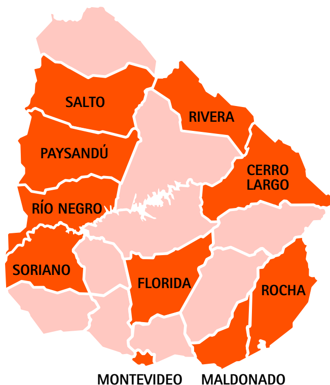
Figura 1. Mapa de Uruguay con los departamentos relevados en los monitoreos

Con el estudio de Montevideo, junto con los realizados en Cerro Largo y Rocha culmina esta fase del monitoreo sobre el estado de situación de los servicios de SSR e IVE que alcanzó a 10 de los 19 departamentos del país: tres de la frontera con Brasil (Riviera, Cerro Largo y Rocha), cuatro del litoral (Salto, Paysandú, Río Negro y Soriano), uno del centro (Florida), uno del sur (Maldonado) y Montevideo, capital del país.